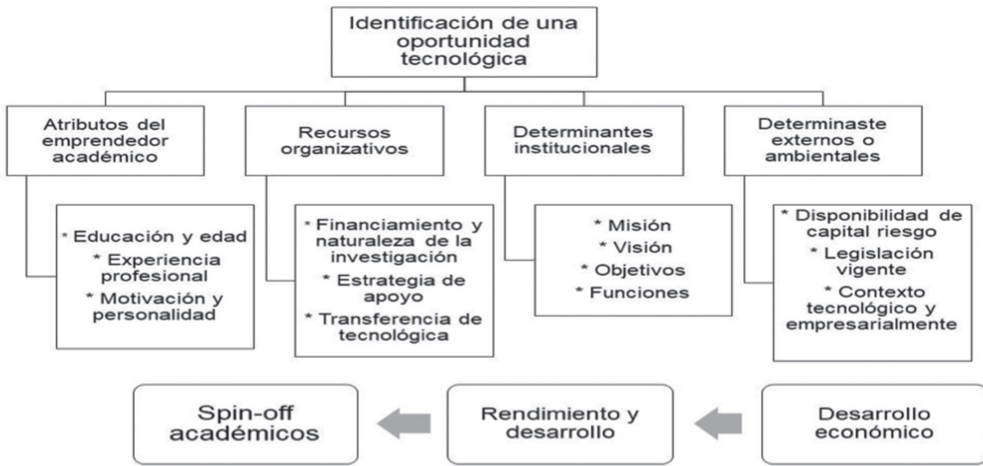
Figura 1: Factores determinantes del modelo de Spin-off

Nota: Elaboración propia basada en la información de O’shea, J., Chevalier, A., y Roche, F. «Entrepreneurial Orientation, Technology Transfer and Spinoff Performance of US Universities»; Research Policy, 2005.